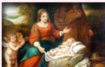
"Il Verbo si è fatto carne e abitò tra noi".